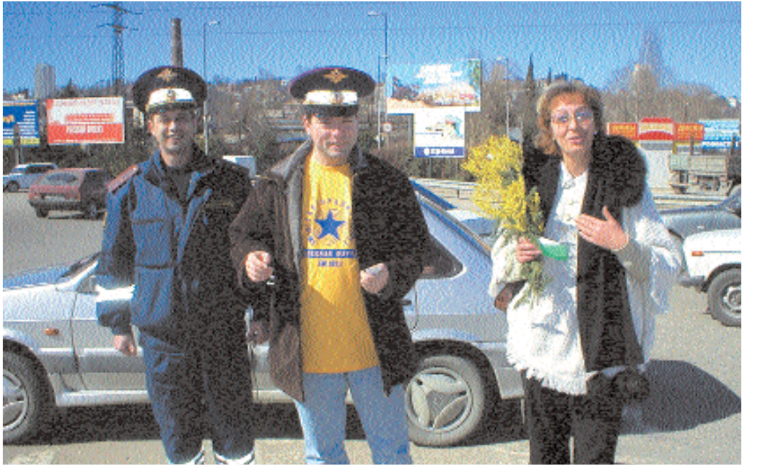
«Авторадио». Во всех трёх городах репортажи о праздничной акции шли в прямом эфире. Многие десятки женщин за рулём удостоились в этот день подарков и поздравлений на улицах Москвы, Питера и Сочи. «Весна, любовь и цветы» — для вас, милые женщины!

Сочи Яркое солнце, южный колорит черноморского города добавляли весенней акции «Авторадио» ещё больше праздничной яркости. Диджей «Авторадио — Сочи» в фирменных авторадийных майках и мили-