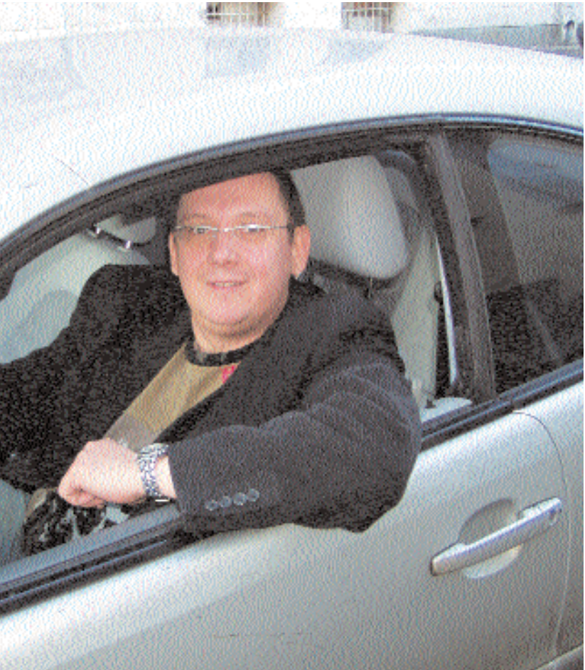
...кем бы ни был человек прежде – как только он купил автомобиль и начал его водить, он стал обыкновенным «водителю»

какой-то спортивный азарт, желание написать тоже что-то хорошее, созвучное по настроению. Например, мне ужасно нравилась одна песня Молчанова, которую пела Ирина Салтыкова. И так она мне нравилась, что под её впечатлением я написал «Солнце моё» для Татьяны Овсиенко. Я говорю всем: она похожа на Молчанова – а мне возражают: ничего похожего! То есть только