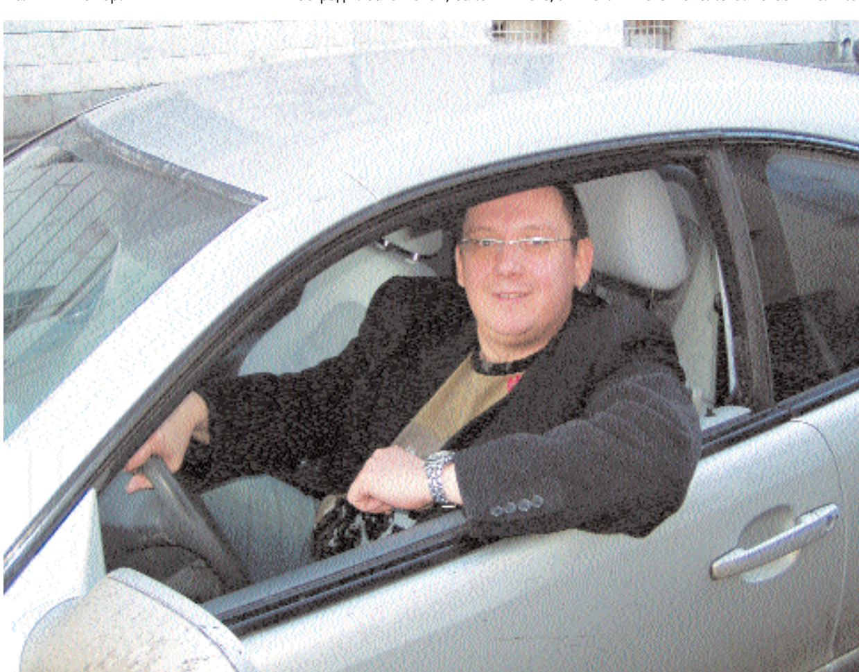
...кем бы ни был человек прежде – как только он купил автомобиль и начал его водить, он стал обыкновенным «водителю»

К примеру, в мюзикле есть номер с гапзушками, танцующими степ. Можно считать этот танец зловещим, можно – сатирическим, а для меня это просто – классно поставленный и виртуозно исполненный танцевальный номер.